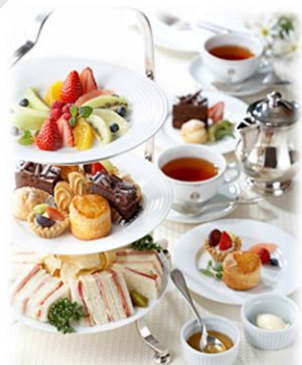
※イメージ写真です。